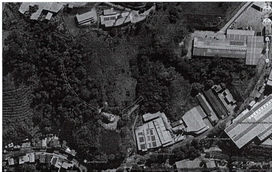
Imagem 01: Área verde a ser desafetada e transferida à Rádio (polígono verde) e área verde a ser permutada e transferida ao Município (polígono amarelo).